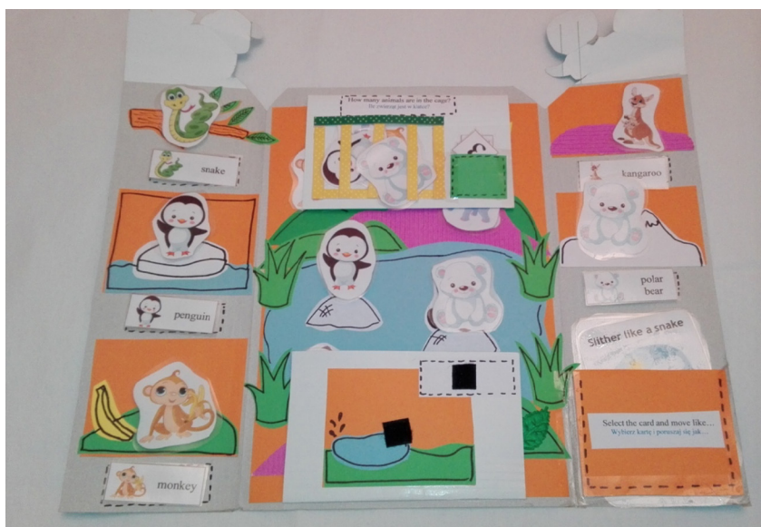
Ryc. 6. Zdjęcia okładki oraz wnętrza lapbooka wykonanego przez nauczycielkę Agnieszkę Puk zainspirowanego piosenką Let's go to the Zoo Super Simple Songs