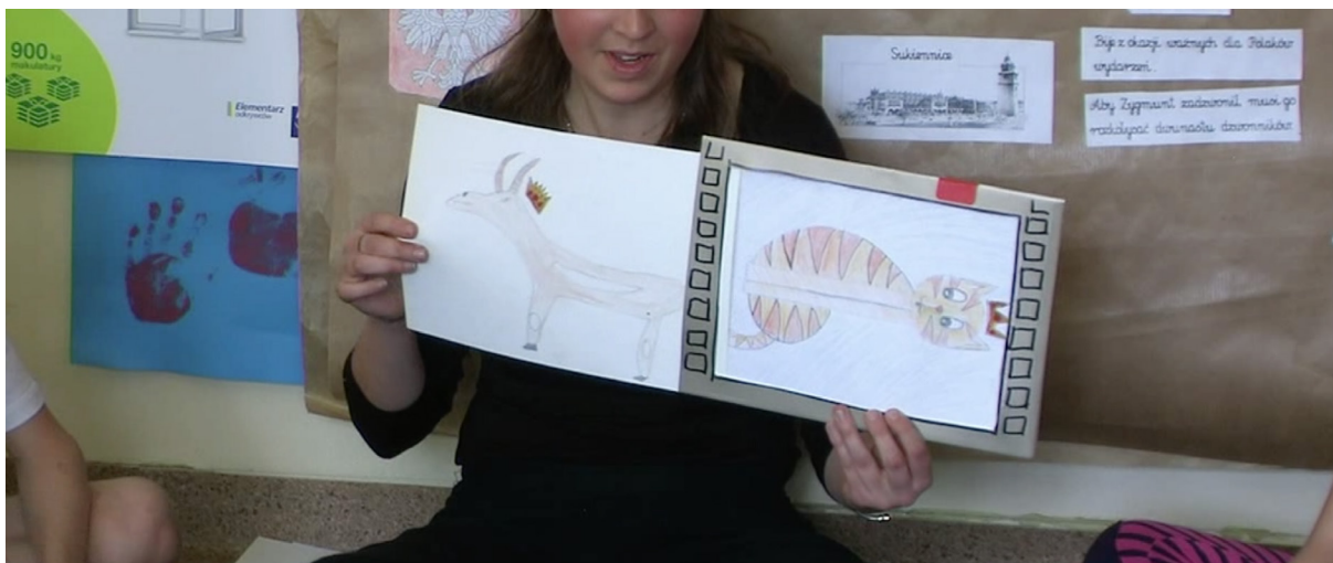
Ryc. 1. Rysunek kota w wykonaniu dziecka i ten sam rysunek kota z dorysowaną przez nauczycielkę koroną