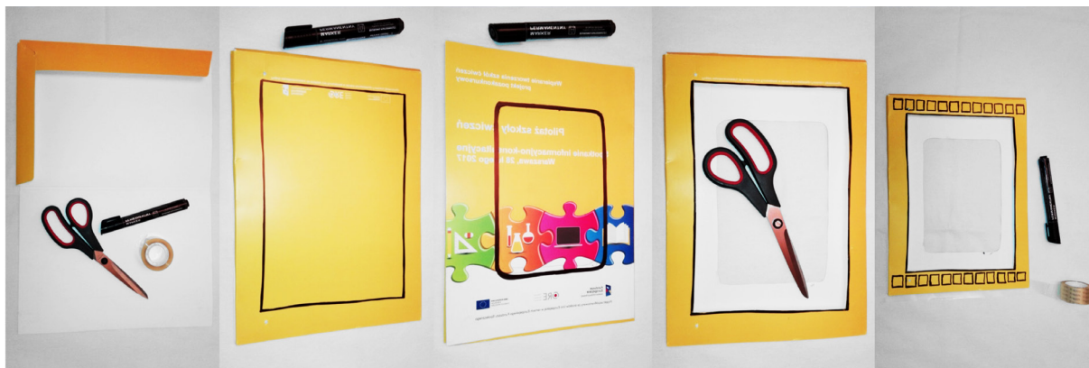
Ryc. 5. Fotograficzna instrukcja wykonania „okienka filmowego”

3. Megan wykonała „okienko filmowe” z używanego folderu reklamowego. Zobacz jak: