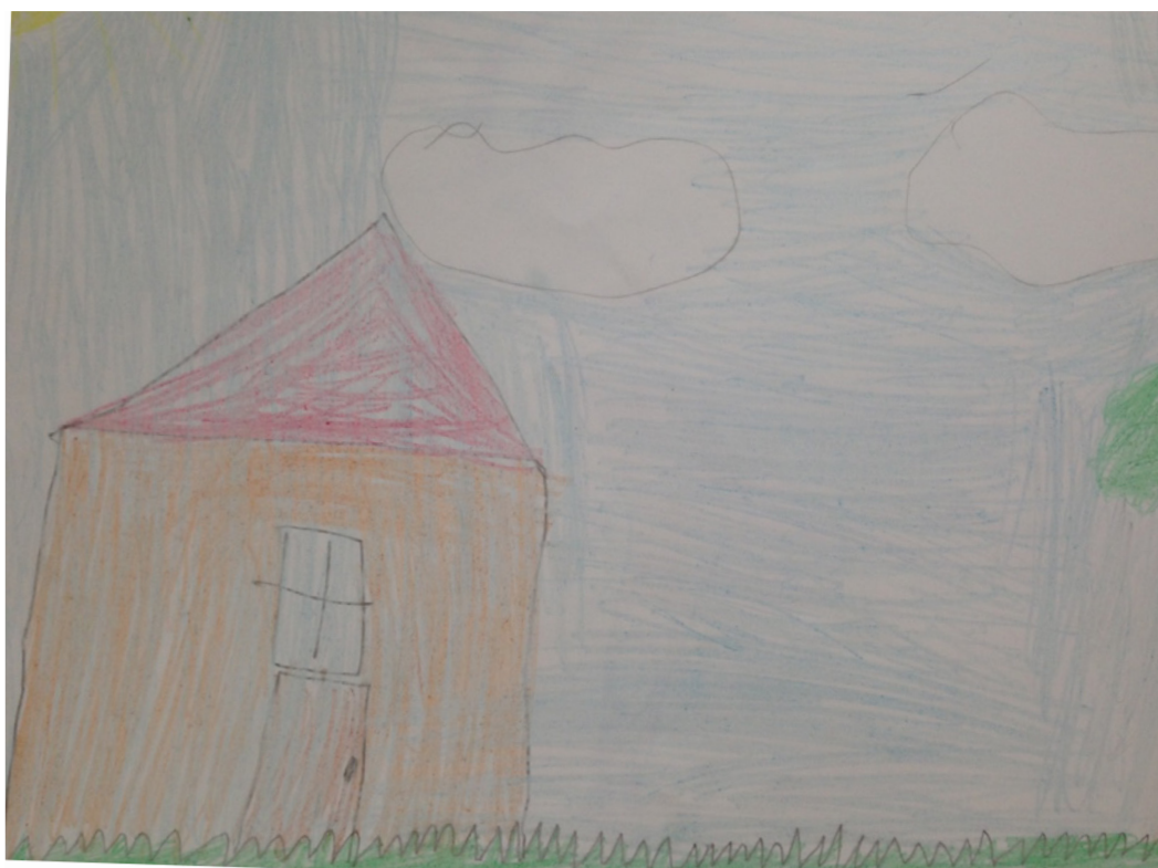
Ryc. 2. Ilustracja wykonana przez ucznia, przedstawiająca dom, słońce i chmury