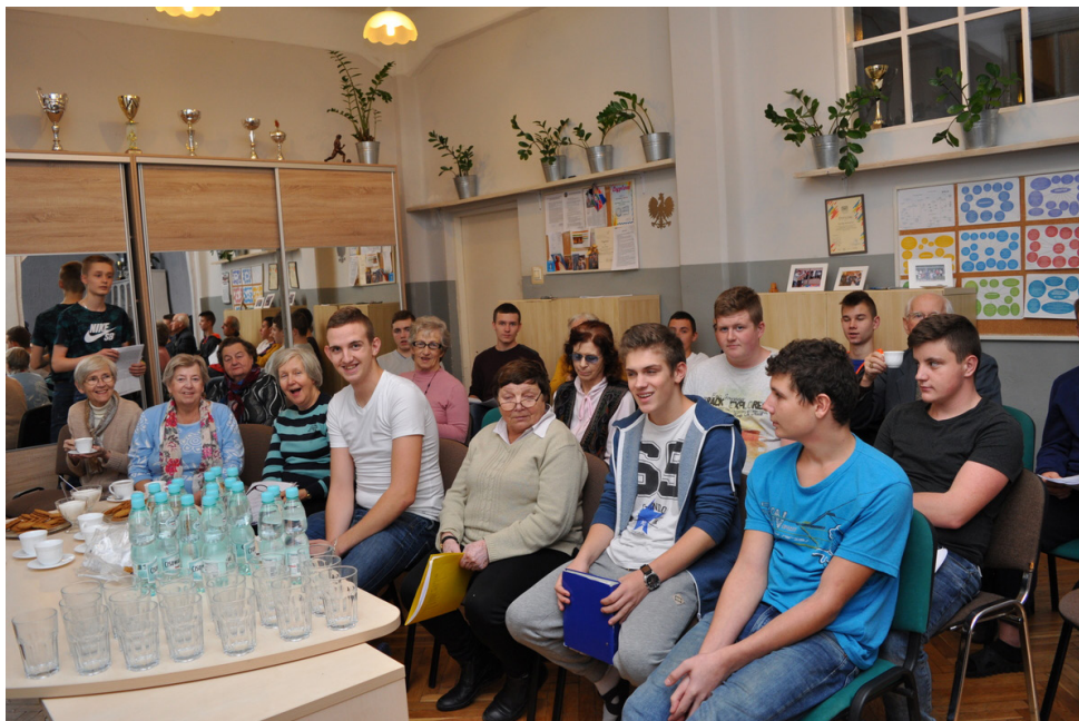
Fot. 1. Próba uczestników projektu w Młodzieżowym Ośrodku Wychowawczym Księży Orionistów.

Po ponad półrocznych próbach międzypokoleniowy chór wystąpił podczas obchodów Święta Niepodległości w Pałacu na Wodzie w Łazienkach Królewskich. Na to niezwykle wydarzenie chłopcy zaprosili swoich rodziców i bliskich. Przyjechali też pozostali wychowankowie naszego ośrodka. Publiczność dopisała i śpiewała razem z nami. Było bardzo uroczyście i wzruszająco.