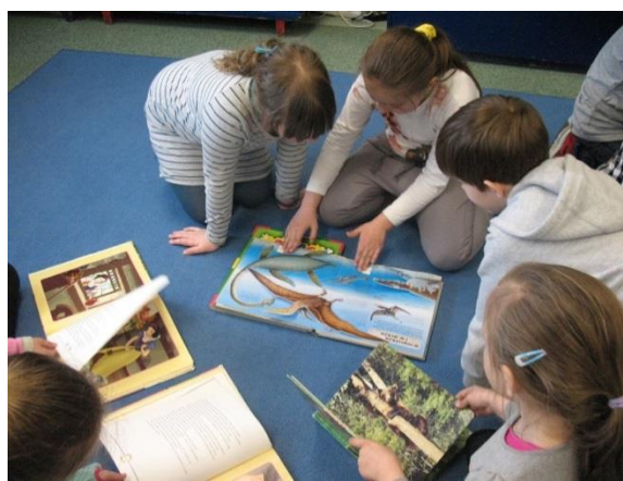
Uczniowie podczas zajęć edukacyjno-terapeutycznych