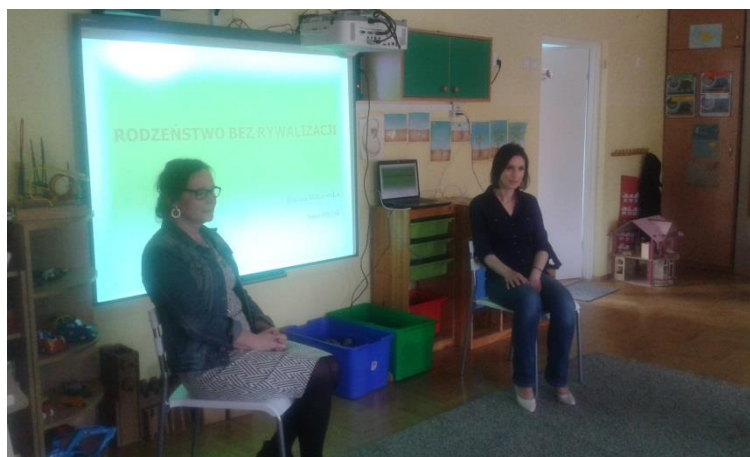
Pracownicy Poradni Psychologiczno-Pedagogicznej nr 1 podczas zajęć warsztatowych dla rodziców „Szkoła dla Rodziców – w pigułce”

Rodzice poznali sposoby radzenia sobie z trudnymi emocjami dziecka, dowiedzieli się, jak należy zachęcać dzieci do współpracy i samodzielności, oraz nabyli umiejętności modyfikowania ich zachowań poprzez konsekwentne działanie i umiejętne chwalenie.