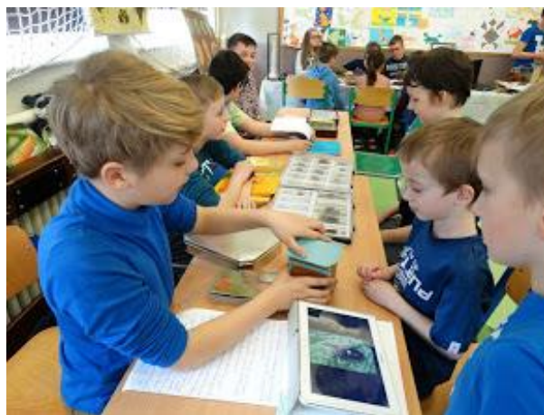
Uczniowie podczas zajęć warsztatowych rozwijających umiejętności społeczne

Podczas zajęć uczniowie mogli nauczyć się rozwiązywania konfliktów i funkcjonowania w trudnych sytuacjach, poznać podstawy asertywności, ćwiczyć umiejętności akceptacji i tolerancji dla inności oraz okazywania sobie szacunku.