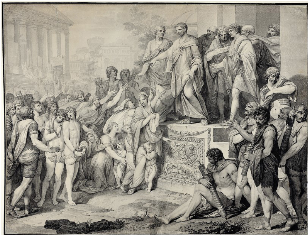
Franciszek Smuglewicz, Brutus skazujący na śmierć swoich synów , 1771, tusz, ze zbiorów króla Stanisława Augusta, Biblioteka Uniwersytecka w Warszawie, Gabinet Rycin

pozalekcyjnym – np. w formacie debaty oksfordzkiej – na tematy związane z powyższą problematyką.