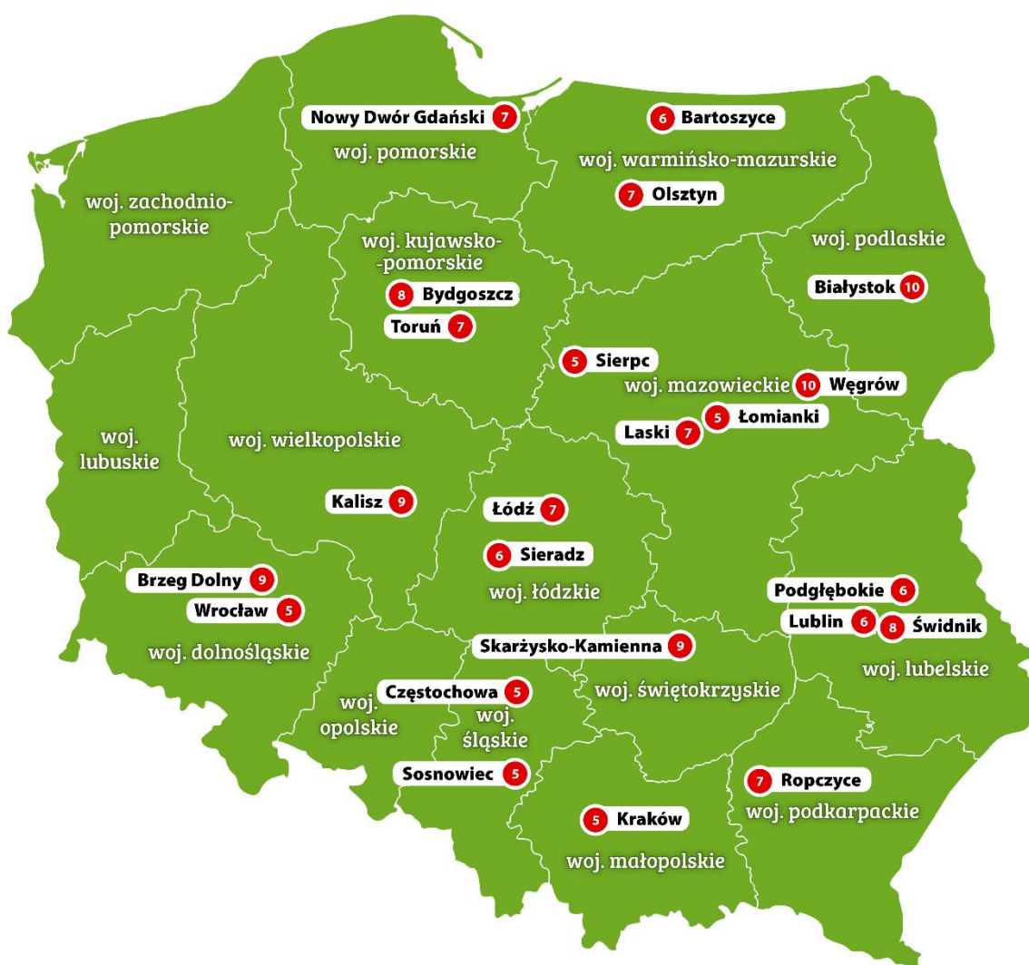
Rys. 3. Mapa Specjalistycznych Centrów Wspierających Edukację Włączającą w Polsce z liczbą placówek ogólnodostępnych objętych wsparciem

8 Miasto - siedziba SCWEW wraz z liczbą przedszkoli i szkół ogólnodostępnych objętych wsparciem