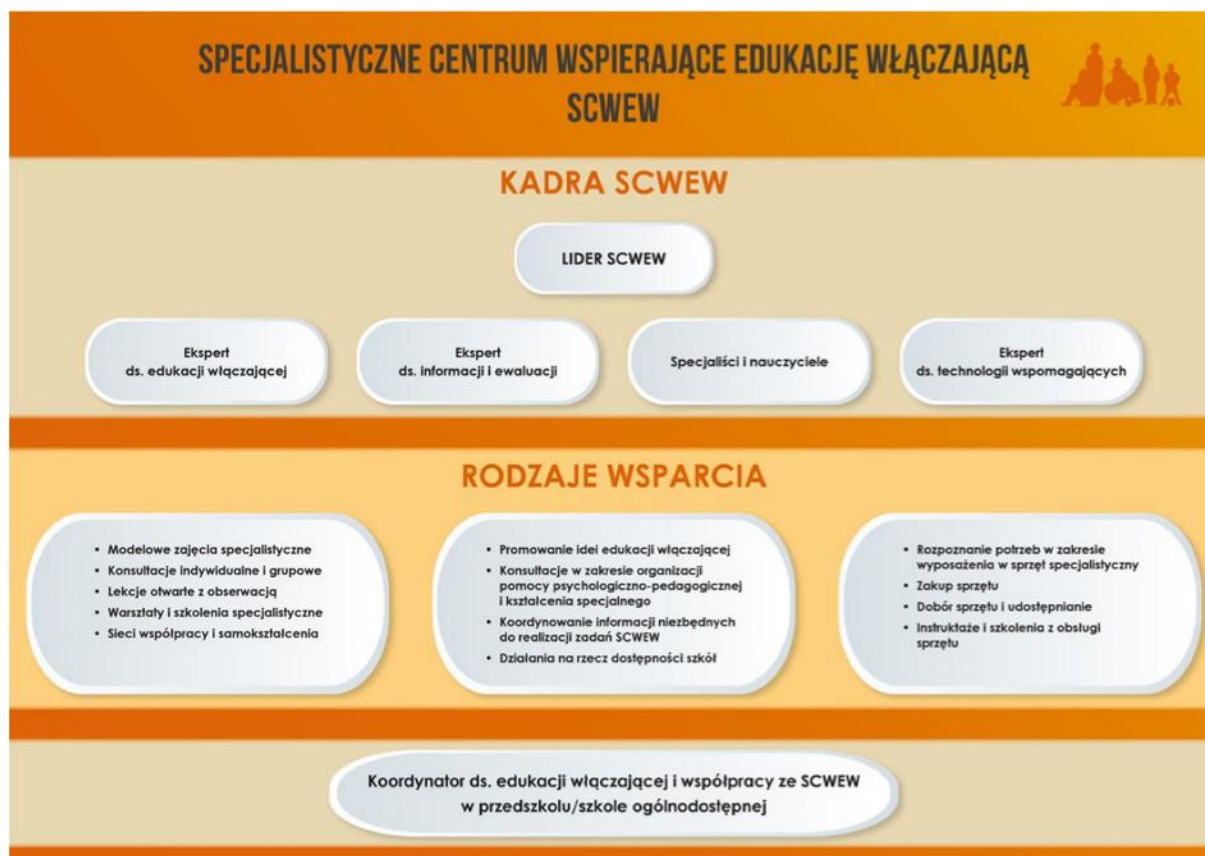
Rys. 2. Kadra SCWEW i rodzaje udzielanego wsparcia

Ważną rolę w tak pomyślanym modelu będzie pełnił koordynator ds. edukacji włączającej i współpracy ze SCWEW w przedszkolu/szkole ogólnodostępnej . To osoba, która zna potrzeby placówki ogólnodostępnej i jest łącznikiem pomiędzy przedszkolem/szkołą a SCWEW. Centra mają bazować w znacznej mierze na nauczycielach z placówek specjalnych, posiadających doświadczenie w pracy z uczniem ze szczególnymi potrzebami edukacyjnymi. Problem okazuje się dużo bardziej skomplikowany, gdyż nauczyciele z placówek specjalnych niejednokrotnie zwracają uwagę na fakt, że ich doświadczenie nie dotyczy pracy z tymi uczniami w dużych zespołach ogólnodostępnych. Patrząc na problem z tej perspektywy, należy zauważyć, że na szeroko pojętym rynku oświatowym jest bardzo mało specjalistów, którzy mieliby takie doświadczenie. Tym bardziej konieczne jest wypracowanie form, metod pracy oraz rozwiązań organizacyjnych wspierających nauczycieli, uczniów, rodziców, dyrektorów i samych specjalistów w procesie edukacji włączającej .